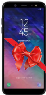
I орын Смартфон Samsung Galaxy A6