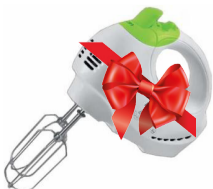
VI орын Миксер Elenberg SW-601

Оқырмандар жүрегіне жол тапқан басылымды одан әрі насихаттау әрі көпшіліктің қызығушылығын тудыру мақсатында оқырмандарға арнап ұтыс ұйымдастырып отырмыз. Ұтыс ойынын «Қазпошта» АҚ-мен бірлесіп отырып, наурыз айының соңында қорытындылайтын боламыз. Оқырмандар ақпан айынан бастап жазылса, газет келесі айдан бастап қолына тиеді.