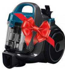
II орын Шаңсорғыш Bosch BGS05A220