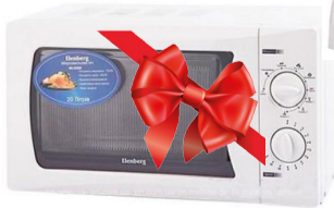
IV орын Қысқатолқынды пеш Elenberg MS-2011M