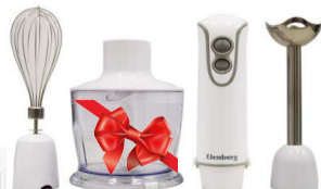
V орын Блендер Elenberg NAT-9601E