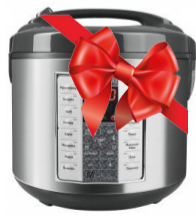
III орын Мультиварка REDMOND RMC-M252