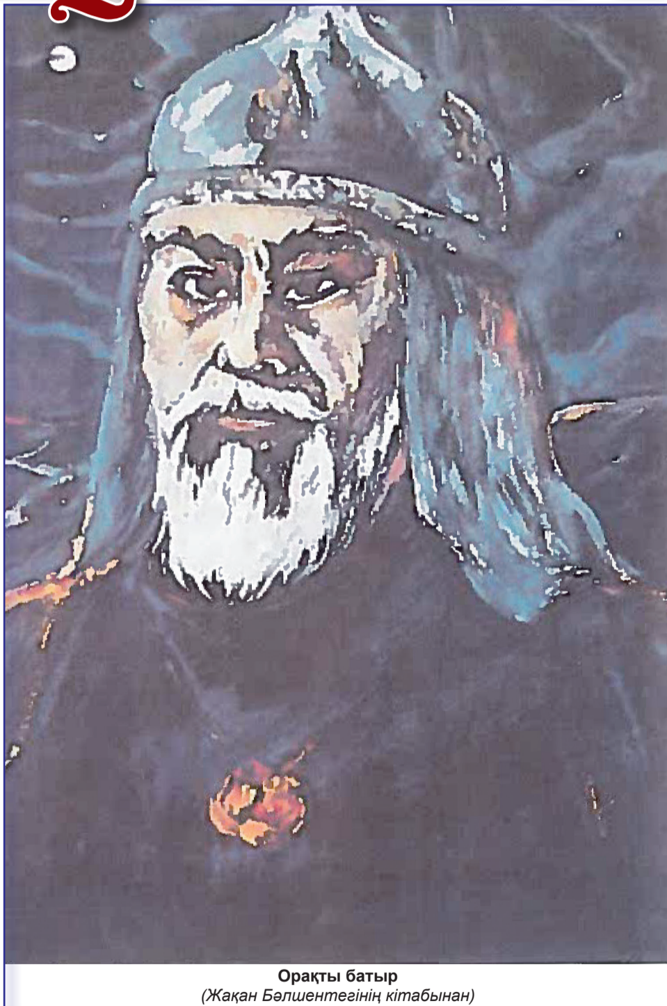
Орақты батыр

Алғашқы 9 ұлды Баһадүр Орақты басқа да деректемелерінде жазылған.