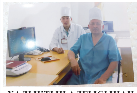
ХАЛЫҚТЫҢ АЛҒЫСЫНАН АРТЫҚ МАРАПАТ ЖОҚ