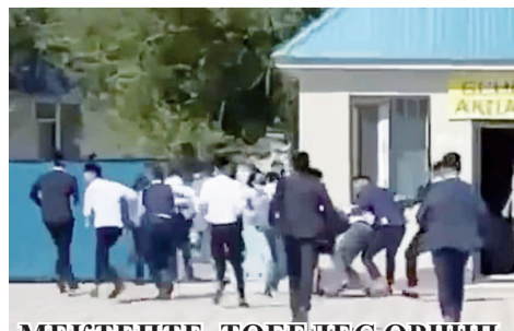
МЕКТЕПТЕ ТӨБЕЛЕС ӨРШПІ, ТӘРБИЕ АҚСАП ТҰР