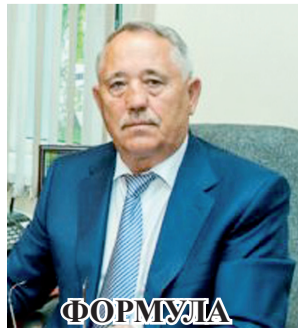
ФОРМУЛА ОБЩЕСТВЕННОГО ЕДИНСТВА