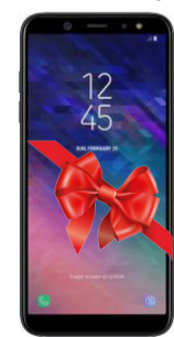
I орын Смартфон Samsung Galaxy A6

Газетке жазылуға байланысты жеке тұлғаларға арнап Instagram парақшасы ашылады. Ұтыс иелерін анықтау жариялы түрде жүргізіледі, яғни Instagram әлеуметтік парақшасында тікелей эфирде өтетін болады. Жеңімпаздар туралы ақпаратты наурыз айында газетке де жариялайтын боламыз. Жазылуға атсалысқан байланыс бөлімшелері де сыйлыққа ұсынылады. Сондықтан газетке жазылғандар түбірек көшірмесін 24-наурызға дейін редакцияға жолдауы міндет. ЕНДЕШЕ, ІСКЕ СӘТ, ҚАДІРЛІ ОҚЫРМАН!