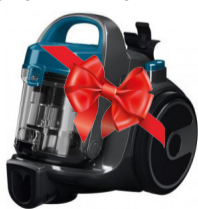
II орын Шаңсорғыш Bosch BGS05A220