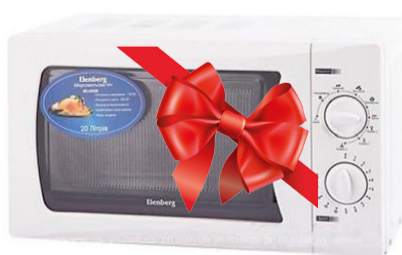
IV орын Қысқатолқынды пеш Elenberg MS-2011M