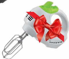
VI орын Миксер Elenberg SW-601

Түбіртектің түпнұсқасын өзіңізде қалдырып, көшірмесін «Қазпошта» арқылы Талдықорған қаласы Қабанбай батыр көшесі, 32-үй 2-қабат мекенжайына жолдаңыз. Индекс: 040000. Немесе түбіртекті сканерден өткізіп, басылымның alatau_offset@mail.ru поштасына жіберуге болады. Сонымен қатар 87028817110 ұялы телефонына WhatsApp желісі арқылы жолдауға мүмкіндігіңіз бар. Қосымша ақпарат: 87714037399 нөмірінен ала аласыздар.