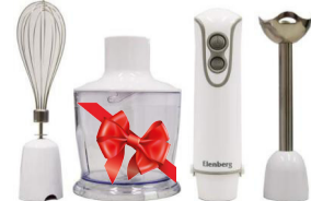
V орын Блендер Elenberg HAT-9601E