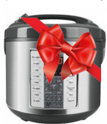
III орын Мультиварка REDMOND RMC-M252