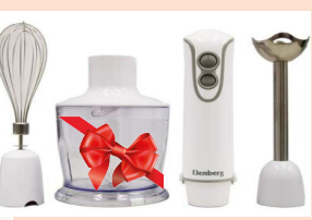
V орын Блендер Elenberg NAT-9601E