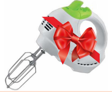
VI орын Миксер Elenberg SW-601

Оқырмандар жүрегіне жол тапқан басылымды одан әрі насихаттау әрі көпшіліктің қызығушылығын тудыру мақсатында оқырмандарға арнап ұтыс ұйымдастырып отырмыз. Ұтыс ойынын «Қазпошта» АҚ-мен бірлесе отырып, қорытындылайтын боламыз. Оқырмандар наурыз айынан бастап жазылса, газет келесі айдан бастап қолына тиеді.