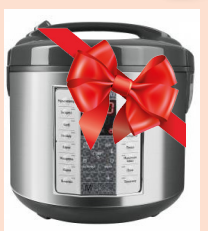
III орын Мультиварка REDMOND RMC-M252