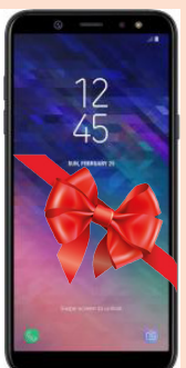
I орын Смартфон Samsung Galaxy A6