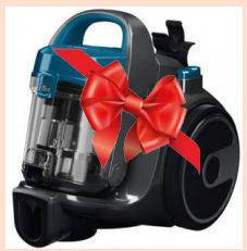
II орын Шаңсорғыш Bosch BGS05A220