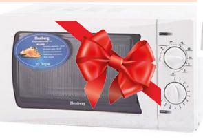
IV орын Қысқатолқынды пеш Elenberg MS-2011M