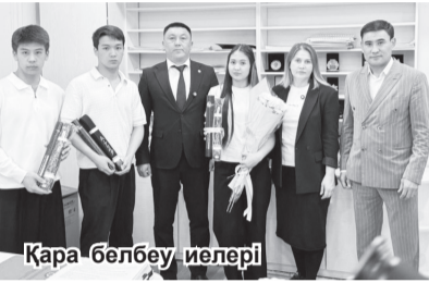
Қара белбеу иелері