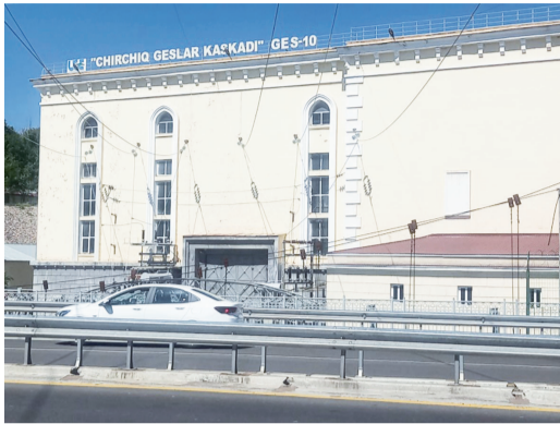
Шыршық өзеніне салынған Аққабақ атындағы ГЭС