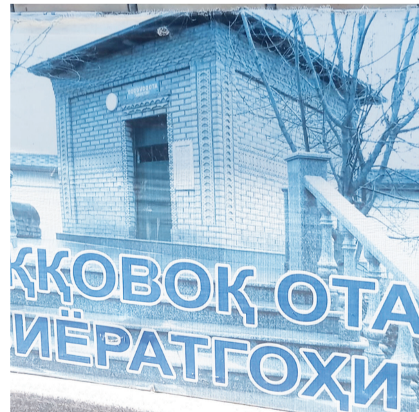
Аққабақ баба кесенесі

Ойда жүрген істің оңтайы келді-ау деп, бір күні таңғы астан кейін «тәуекел» деп, Бостандық туманына (ауданына) таксиге отырып, жүріп кетеді. Ташкент пен Бостандық ауданының орталығы