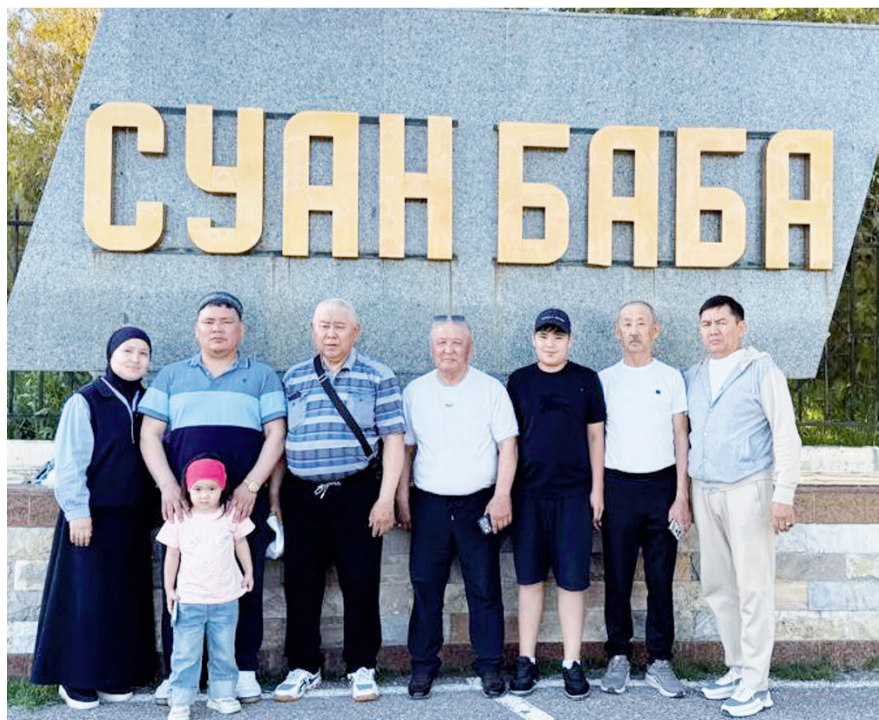
Суан баба ескерткіші

Бұл сапарымызды ата-баба рухына құрмет көрсету үшін жасаған перзенттік парыз, міндет деп білеміз.