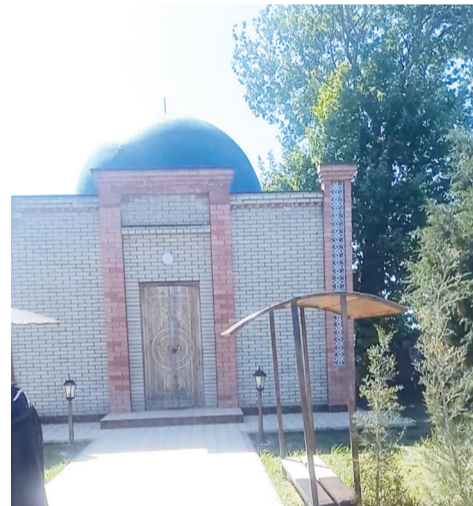
Жаңа салынған кесене

Аман жүр, қош бол, бауырлар туған, Хат хабар алысып тұрайық әр сәт. Түбіміз бірге атамыз Суан, Жазиралы дала, қаласы Жаркент.