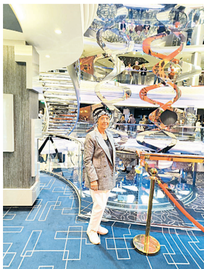
Нұрқатипа лайнердің ішінде

Біз мектепте жүргенде газет-журнал оқитынбыз. Ол кезде теледидар көп тарай қоймаған кез, радио тыңдайтынбыз. Жоғарғы класстарда «Білім және еңбек» деген журнал болды, орта класстарда