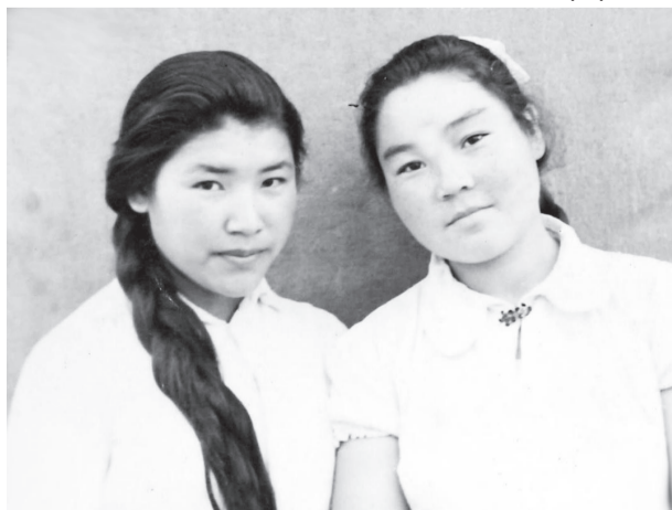
Батима мен Келеке