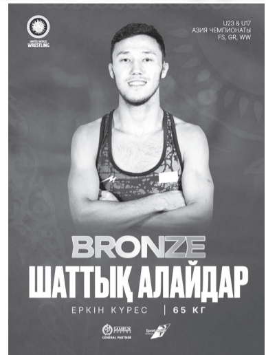
BRONZE ШАТТЫҚ АЛАЙДАР ЕРКІН КҮРЕС | 65 КҒ

қоржынға салды. Словенияның Камник қаласында садақ атудан «Veronica's Cup» халықаралық турнирі өтті. Дәстүрлі бәсекеге биыл 30-ға жуық мемлекеттен 330-дан астам мерген қатысты. Ересектер санатында Қазақстан