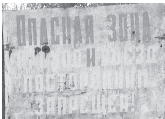
Текелідегі қорғасын-мырыш комбинатының зиянды қалдықтары жиналған төбе (хвостохранилище)

4. Траншекаралық бақылау (Іле өзені). Ең ірі өзен — Іле Қытай аумағынан бастау алатындықтан, оның су деңгейі мен тазалығын сақтау трансшекаралық деңгейде шешіледі. Қазақстан мен ҚХР арасындағы су бөлінісі және Балқаш көлінің тартылып кетпеуін қамтамасыз ету мәліметтері халықаралық комиссиялар аясында талқыланып отырады.