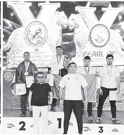
күнделікті шеберлігімізді шындаумен үзбей шұғылданып келеміз. Осылайша, еткен еңбек, төккен тер өз телеуін беруде. Орайы келгенде,